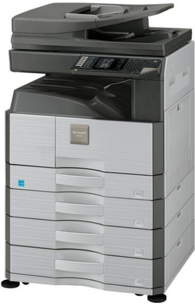
Resimde MX-6026N Modeli gösterilmiştir

KÜÇÜK OFİSLERDEN NETWORK ORTAMLARINA KADAR ÜRETKENLİĞİ EN ÜST SEVİYEYE ÇIKARTAN ÇOK FONKSİYONLU CİHAZLAR